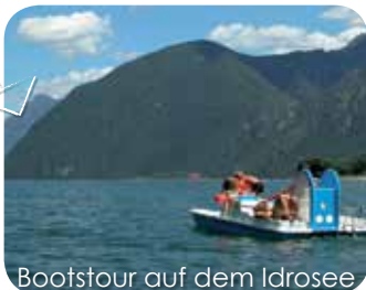
Bootstour auf dem Idrosee