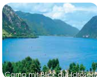
Camp mit Blick auf Idrosee