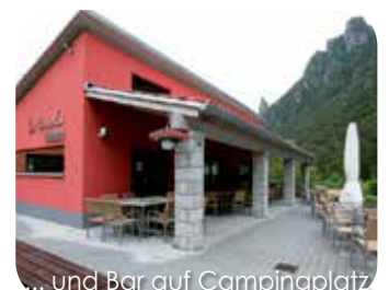
... und Bar auf Campingplatz